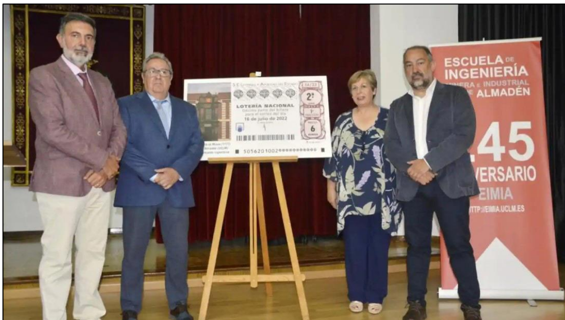
Figura 19: Presentación del sorteo en Almadén

un cupón para conmemorar el acontecimiento (Fig. 18). En él aparece la fachada de la antigua Escuela, fundada como academia en 1777 por orden del rey Carlos III. Fue la primera institución de su género en España, y la cuarta en el mundo tras las de Freiberg (Sajonia, 1767), Banská Štiavnica (Eslovaquia, 1770) y San Petersburgo (Rusia, 1772). En 1835, la Escuela se trasladaría a Madrid.