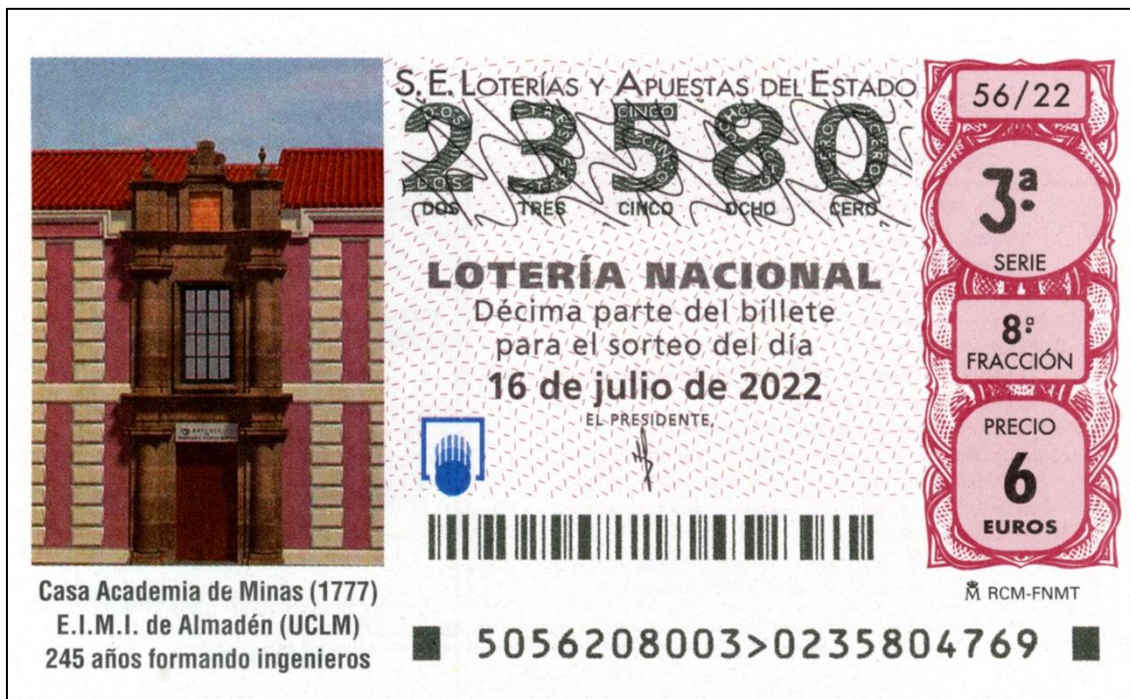
Figura 20: Décimo dedicado a la Escuela de Minas

También la Lotería Nacional (Fig. 19) se unirá a la celebración poniendo a la venta su tradicional décimo de los sábados (sorteo nº 56 del presente año) el día 16 de julio (Fig. 20). En la viñeta vemos la puerta principal de entrada de la antigua Casa Academia de Minas (Fig. 21).