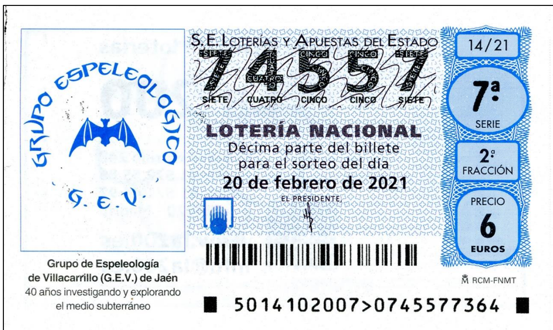
Figura 11: Décimo dedicado al G.E.V.