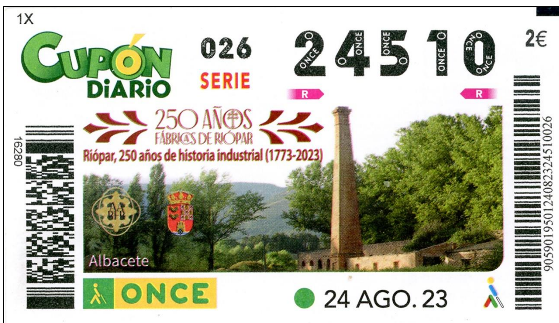
Figura 23: Cupón dedicado a las Fábricas de Riopar

Un solo ejemplar del tema se emitirá en el presente periodo, y será el cupón de la ONCE del día 24 de agosto con el que se conmemora el 250 aniversario de las Reales Fábricas de Bronce y Latón de San Juan de Alcaraz (Fig. 23 y 24). Situadas en la localidad albaceteña de Riopar, en la comarca de la Sierra de Alcaraz, las fábricas fueron creadas en 1773 por un ingeniero vienés nacionalizado español, Juan Jorge Graubner.