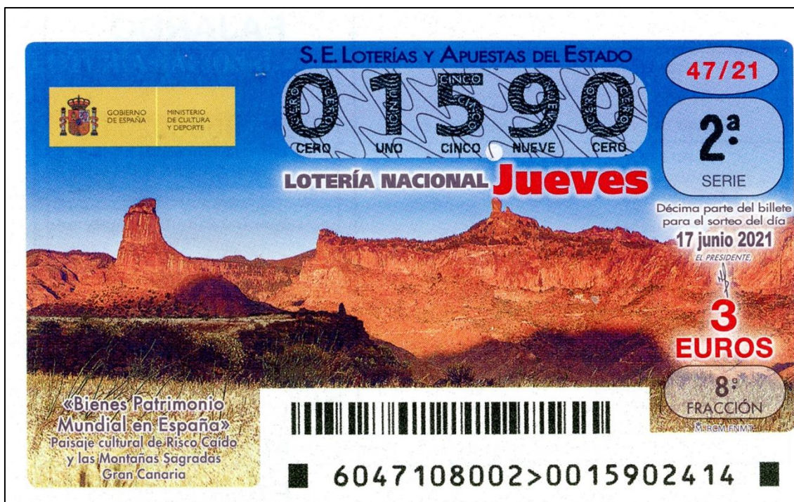
Figura 15: Paisaje de Risco Caído

Finalmente, el sorteo con el que se cerraba el ciclo dedicado a los Bienes del Patrimonio Mundial en España, se dedicó al Arte Rupestre del Arco Mediterráneo de la Península Ibérica, Comunidades Autónomas de Aragón, Cataluña, Valencia, Castilla-La Mancha, Murcia y Andalucía, sin que hayamos podido precisar en qué cueva se encuentra la pintura del par de animales (aparentemente cérvidos) que se muestra en los décimos (Fig. 16).