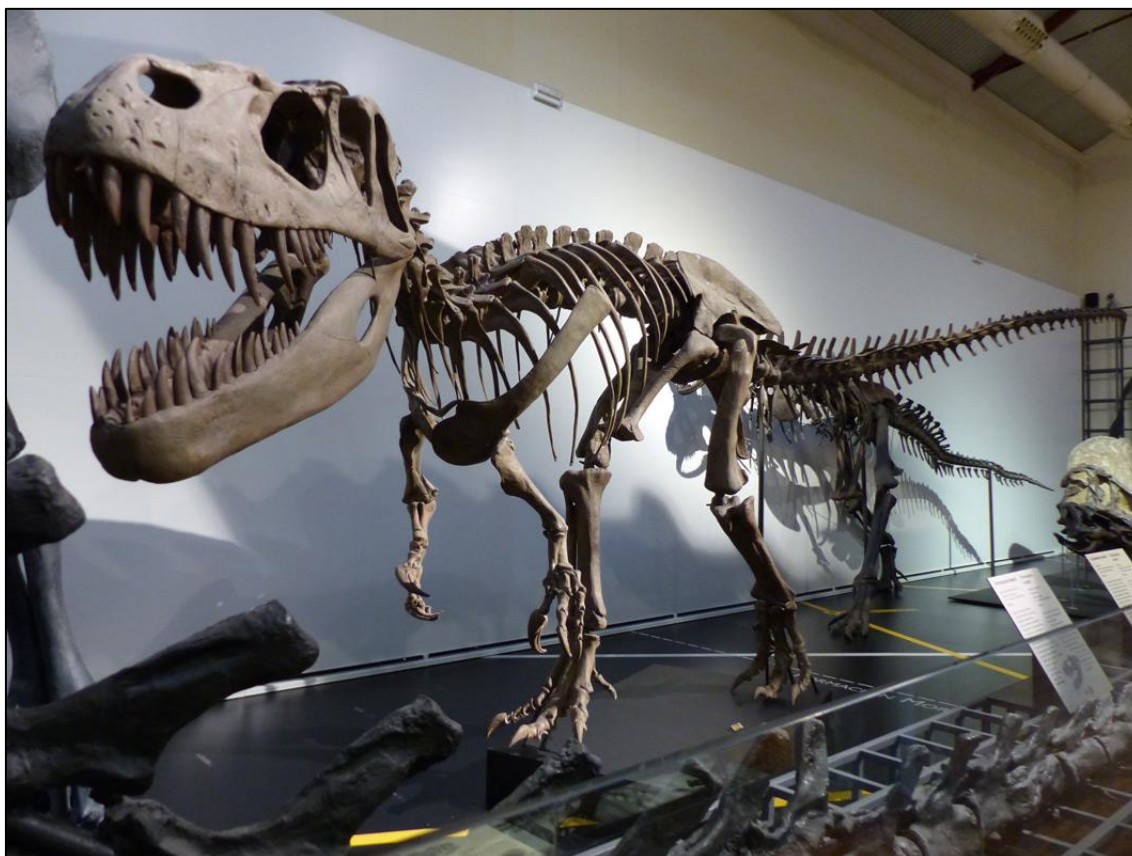
Figura 4: Torvosaurus