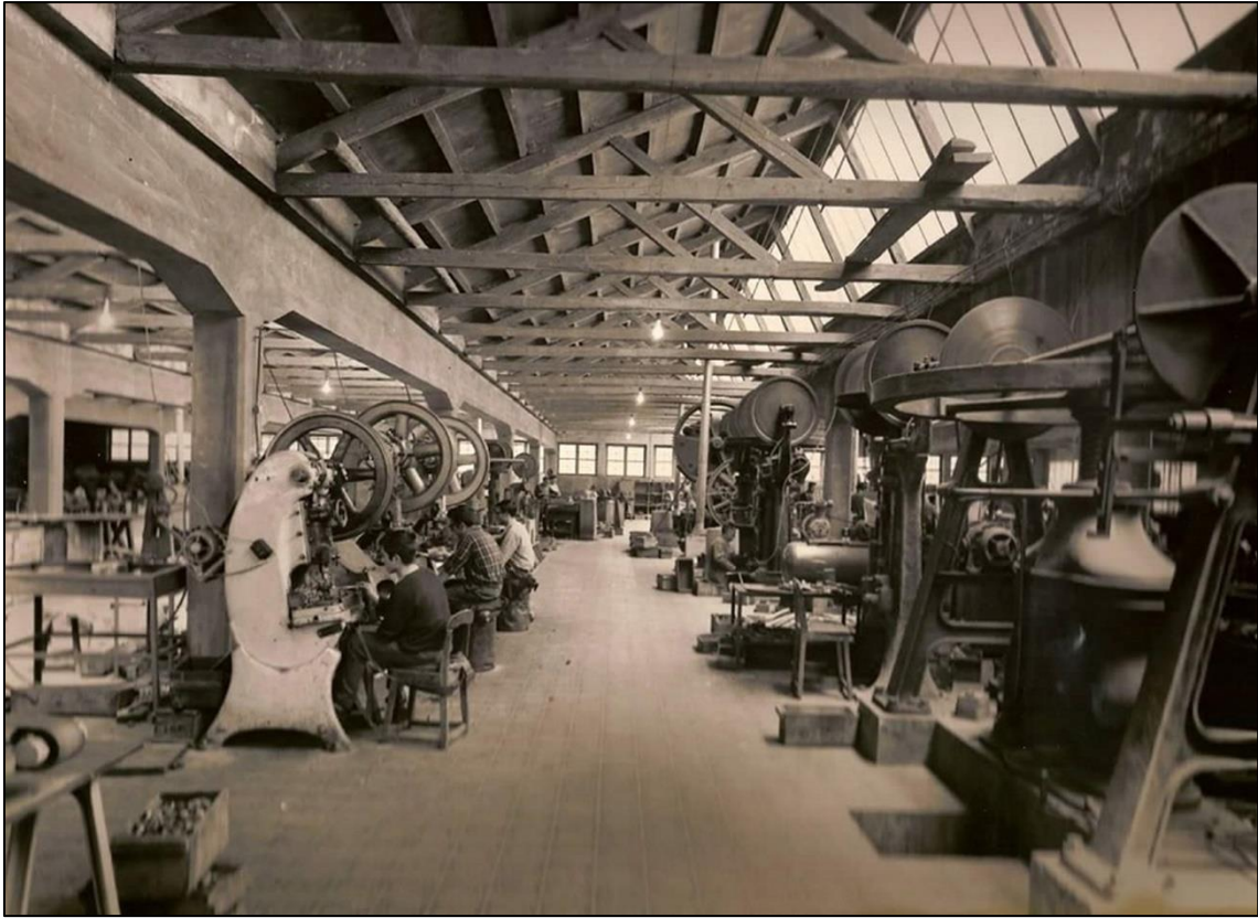
Figura 24: Las Reales Fábricas, en 1879 (Diario Albacete Capital, 2023)

En sus alrededores se encontraban ricos yacimientos de calamina, cuyo cinc era fundido junto al cobre para obtener la aleación llamada latón, siendo este centro fabril el primer productor nacional y el segundo a nivel europeo, tras el de Goslar en Alemania, en el estado federado de la Baja Sajonia.