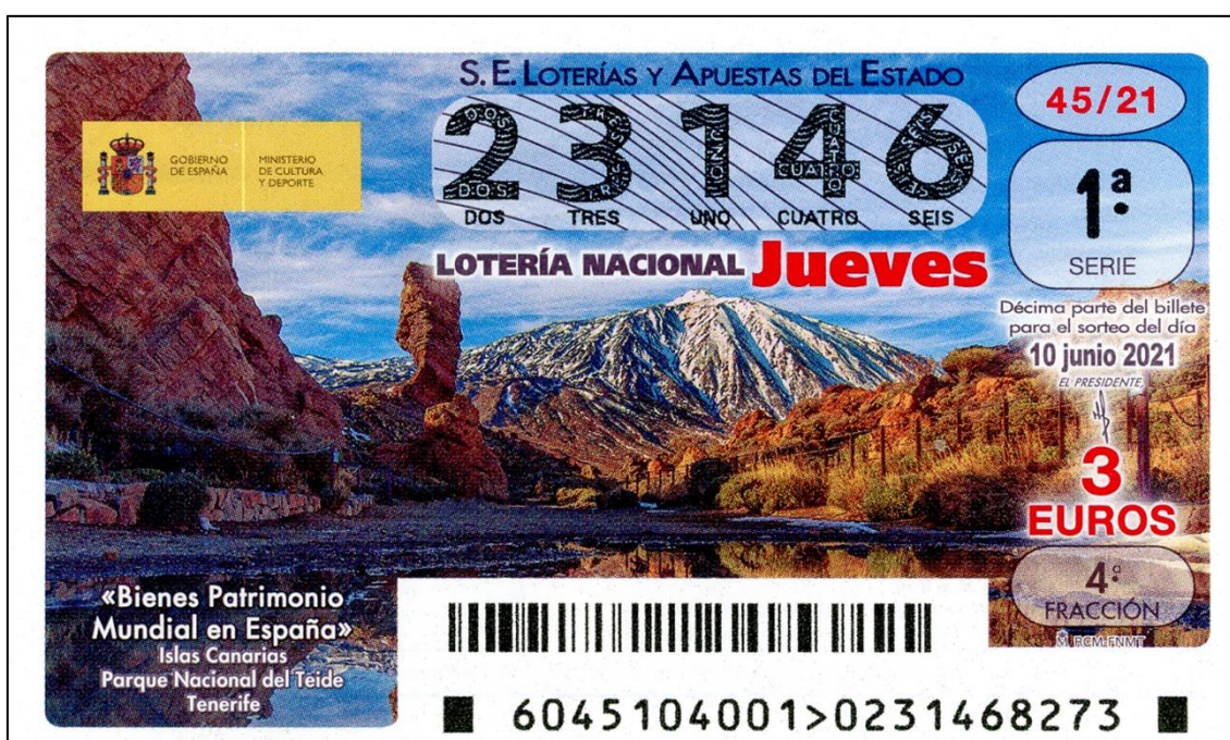
Figura 14: El Teide, en el décimo de Loterías

Las impresionantes minas de oro de Las Médulas (Fig. 13) aparecen en los décimos de un nuevo sorteo del jueves, concretamente en el celebrado el 20 de mayo, dentro de la serie dedicada a los Bienes Patrimonio Mundial en España. Continuando con los sorteos enmarcados dentro de esta misma serie, le llega el turno ahora a los de las Islas Canarias: En los décimos del que se celebró el 10 de junio figura una bonita imagen del Parque Nacional del Teide (Fig. 14), destacando en ella el célebre volcán cubierto de nieve, mientras que el del siguiente jueves, día 17, estuvo dedicado al Paisaje Cultural de Risco Caído y las Montañas Sagradas de Gran Canaria, con una típica fotografía de su paisaje volcánico (Fig. 15).