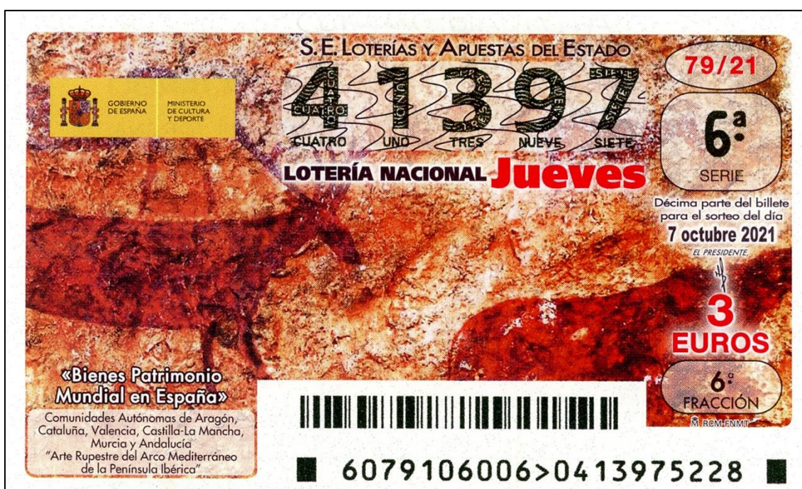
Figura 16: Pinturas rupestres (Col. y foto J.M. Sanchis)

Finalmente, el sorteo con el que se cerraba el ciclo dedicado a los Bienes del Patrimonio Mundial en España, se dedicó al Arte Rupestre del Arco Mediterráneo de la Península Ibérica, Comunidades Autónomas de Aragón, Cataluña, Valencia, Castilla-La Mancha, Murcia y Andalucía, sin que hayamos podido precisar en qué cueva se encuentra la pintura del par de animales (aparentemente cérvidos) que se muestra en los décimos (Fig. 16).