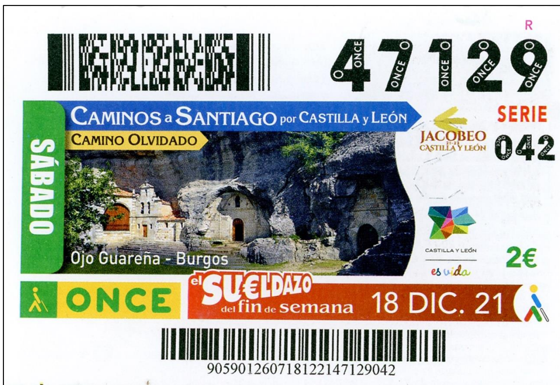
Figura 9: Ojo Guareña en el cupón de la ONCE