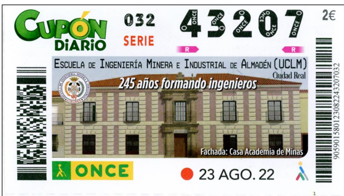
Figura 18: Fachada de la Escuela de Minas de Almadén (Col. y foto J.M. Sanchis)

Con motivo de celebrarse en Almadén el 245 aniversario de la Escuela de Minas, la Organización Nacional de Ciegos de España puso a la venta el 23 de agosto