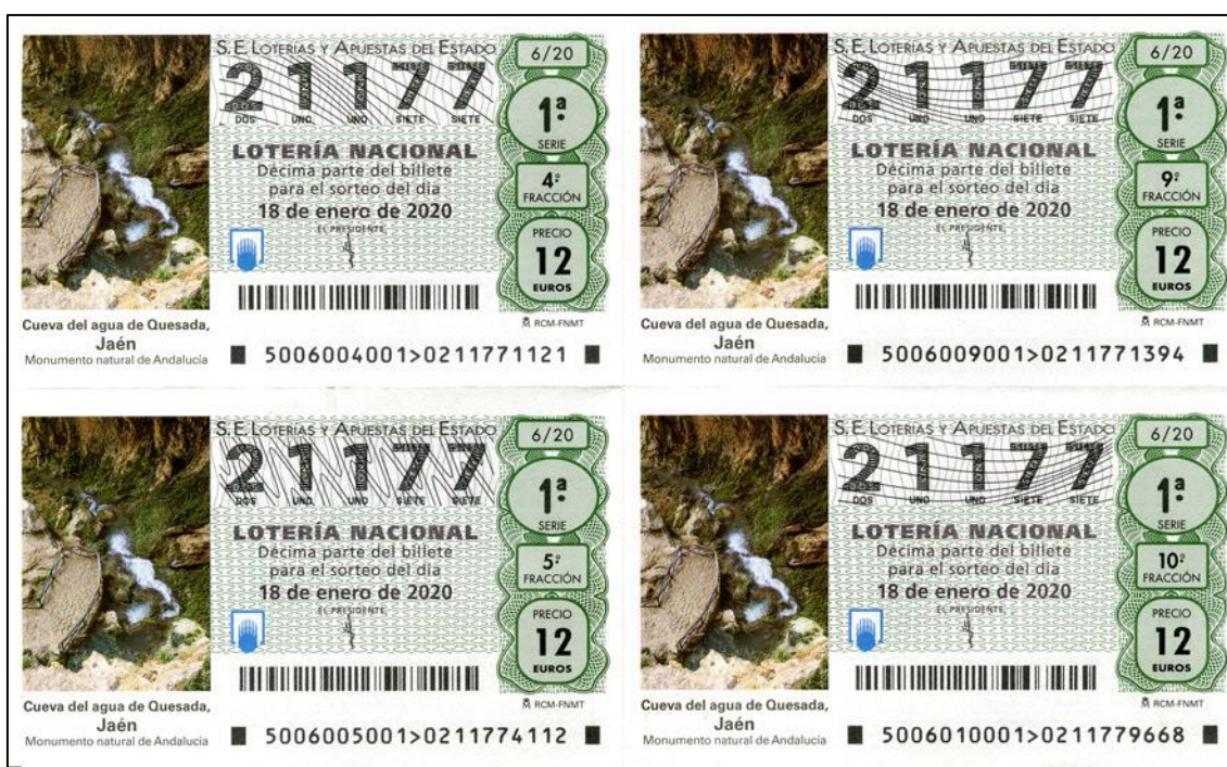
Figura 1: Décimo de la Cueva del Agua

Hasta mediados del mes de marzo el cupón de la ONCE se vendió con toda normalidad, suspendiéndose su distribución entre los días 16 al 22, cuando la totalidad de los cupones ya se habían impreso. Algo similar ocurrió en el mes de abril, mes en el que únicamente se celebraron dos sorteos (días 21 y 23), mientras que el resto de días, pese a tenerse ya impresos los cupones, no se pusieron en circulación. En algunas fechas del mes de mayo sucedería lo mismo, y no se recuperaría la normalidad hasta el 15 de junio, aunque en todo este año no hubo ningún cupón de la ONCE con referencias geológico-mineras.