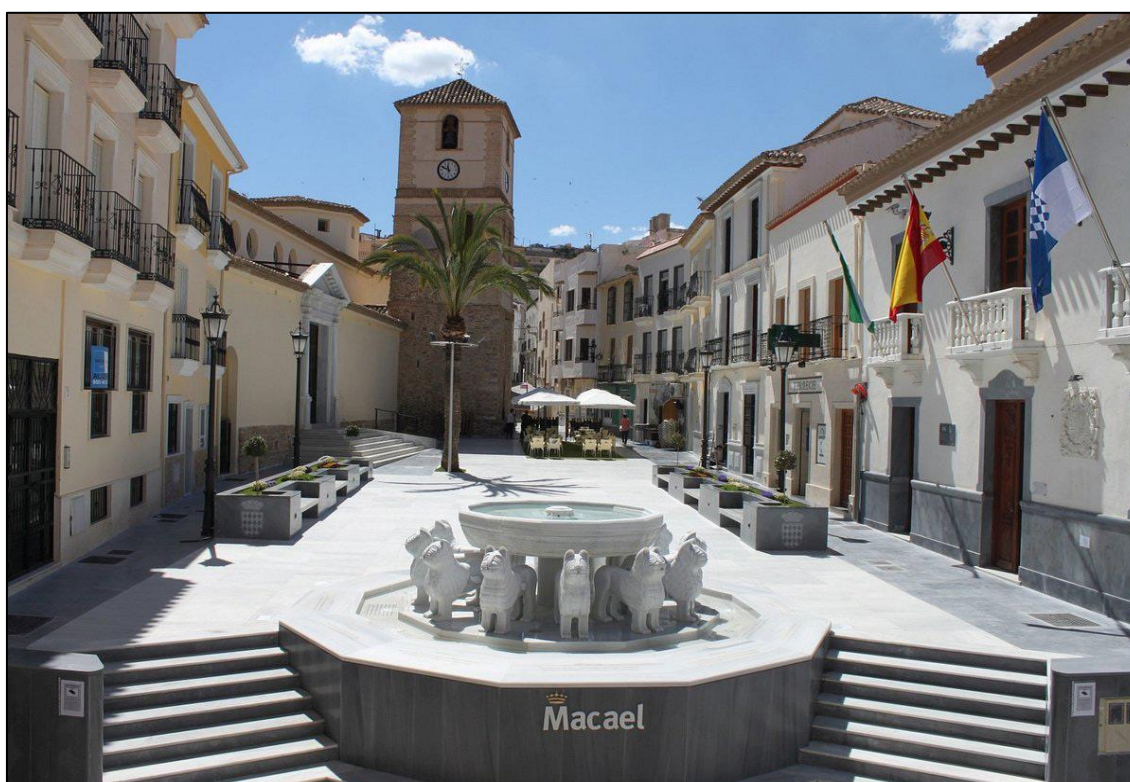
Figura 6: Plaza y fuente de Macael

Esta icónica obra de ingeniería (Fig. 7) fue inaugurada el 27 de abril de 1904 por el Rey Alfonso XIII. Para su construcción se emplearon casi 4.000 toneladas de acero escocés, empleándose además 8.000 metros cuadrados de madera y unos 1.150 metros cúbicos de hormigón hidráulico. Dejó de utilizarse en septiembre de 1970. En 1998 fue declarado Bien de Interés Cultural, constituyendo uno de los mejores ejemplos de arquitectura industrial de España. En el año 2010 se inició la primera fase de su restauración, y en 2020 se acometió la segunda, dotándolo de iluminación ornamental y habilitando en él un mirador que se inauguró en abril de 2023 (Fig. 8).