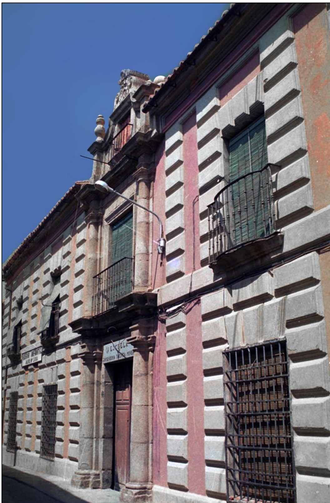
Figura 21: Fachada de la antigua Escuela

El 6 de octubre, nuevamente será Altamira y su Museo Nacional y Centro de Investigación la que ilustre los décimos de ese jueves (Fig. 22), mostrándonos la pintura de una cierva del Magdalenense Inferior que se encuentra en los muros de esta cavidad, conocida en el mundo entero por la extraordinaria calidad de sus pinturas. Con este sorteo finaliza en 2022 la emisión de cupones y décimos de la temática que desarrollamos.