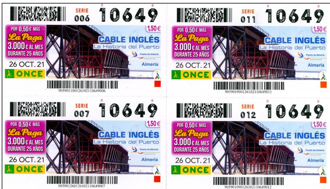
Figura 7: Cupones del Cable Inglés