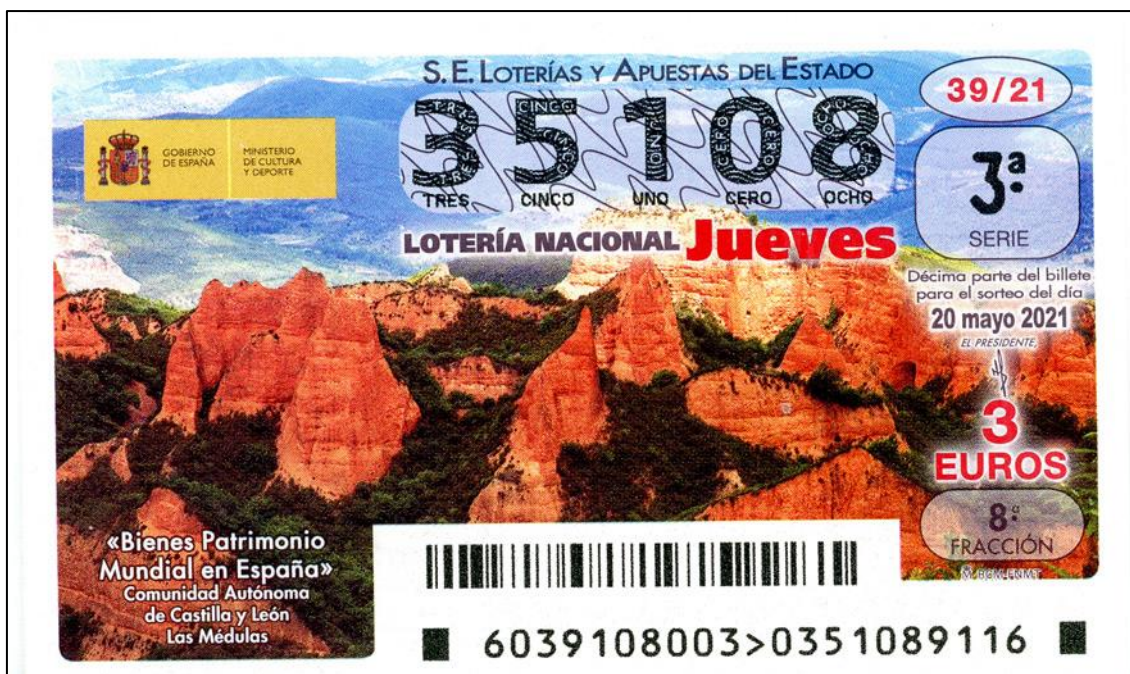
Figura 13: Minas de oro de Las Médulas

Las impresionantes minas de oro de Las Médulas (Fig. 13) aparecen en los décimos de un nuevo sorteo del jueves, concretamente en el celebrado el 20 de mayo, dentro de la serie dedicada a los Bienes Patrimonio Mundial en España. Continuando con los sorteos enmarcados dentro de esta misma serie, le llega el turno ahora a los de las Islas Canarias: En los décimos del que se celebró el 10 de junio figura una bonita imagen del Parque Nacional del Teide (Fig. 14), destacando en ella el célebre volcán cubierto de nieve, mientras que el del siguiente jueves, día 17, estuvo dedicado al Paisaje Cultural de Risco Caído y las Montañas Sagradas de Gran Canaria, con una típica fotografía de su paisaje volcánico (Fig. 15).