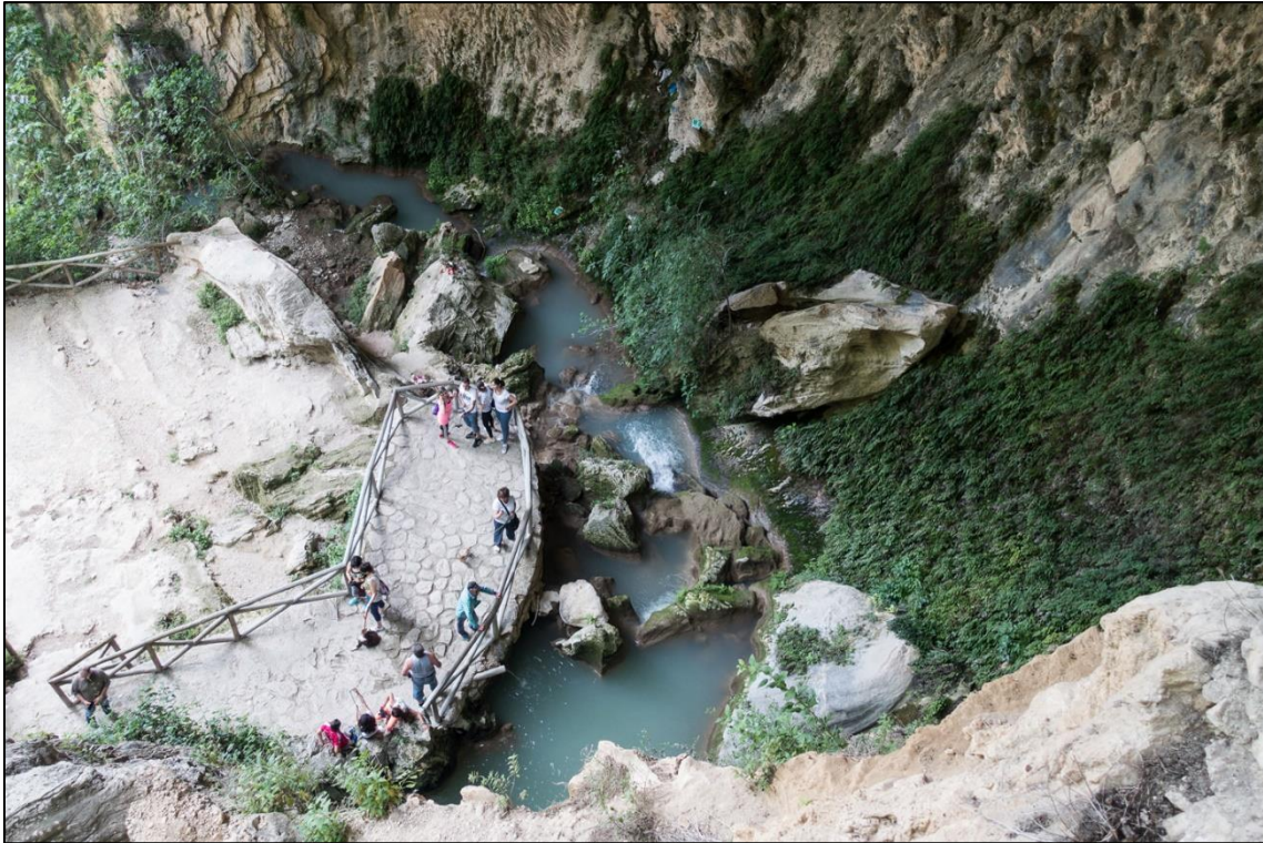
Figura 2: Cueva del Agua