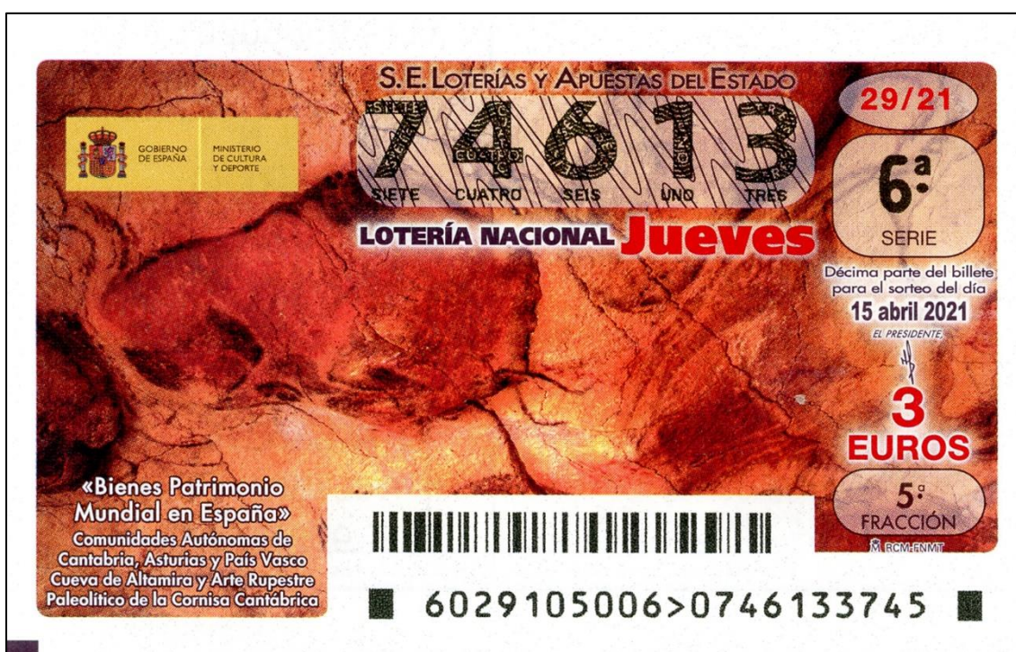
Figura 12: Bisonte de Altamira

El popular sorteo de Loterías del Estado de los jueves, celebrado el 15 de abril, estuvo dedicado a los Bienes Patrimonio Mundial en España en las Comunidades Autónomas de Cantabria, Asturias y País Vasco. Cueva de Altamira y Arte Rupestre Paleolítico de la Cornisa Cantábrica. Los décimos de este sorteo estaban ilustrados por la conocida pintura de un bisonte que se encuentra en la Cueva de Altamira (Fig. 12). No era la primera vez que aparecía en décimos de lotería alguna de las pinturas rupestres de esta famosísima cueva, puesto que el sorteo celebrado el día 26 de mayo de 2001 se había dedicado al Museo de Altamira y su neo cueva, ilustrándose los décimos con uno de los bisontes del Paleolítico que allí se encuentran representados en sus muros.