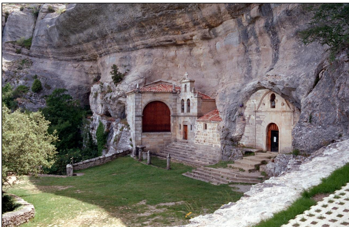
Figura 10: Entrada a la gruta

En lo que respecta a los sorteos de la Lotería Nacional de este año, varios fueron los billetes que se vieron ilustrados con imágenes relacionadas con temas geológicos o mineros. En el primero de ellos, celebrado el 20 de febrero, se conmemoraba el 40 aniversario del Grupo Espeleológico (G.E.V.), de Villacarrillo, Jaén (Fig. 11), reconociendo así sus numerosas investigaciones y exploraciones del medio subterráneo español.