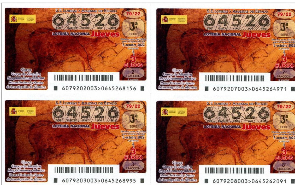
Figura 22: Décimos con la cierva de Altamira