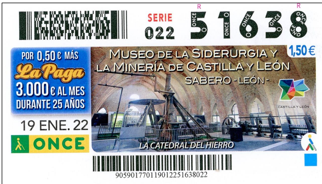
Figura 17: El Museo de Sabero, en el cupón ONCE

El año temático se inicia el 19 de enero, fecha en la que la ONCE dedica su cupón al Museo de la Siderurgia y la Minería de Castilla y León (Fig. 17), ubicado en el fantástico edificio que antaño ocupó en Sabero la Ferrería de San Blas, conocida como “La catedral del hierro”, primera instalación siderúrgica española creada en 1846 por la Sociedad Palentina-Leonesa de Minas. Fueron los primeros altos hornos de cok de España, y se mantuvieron en actividad hasta 1862. La ONCE ya le había dedicado al Museo de Sabero otro cupón en el sorteo celebrado el 10 de enero del año 2010.