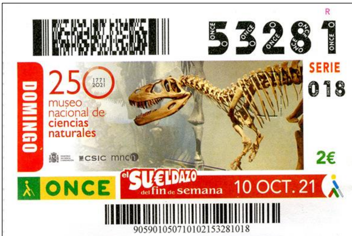
Figura 3: Cupón dedicado al Museo

conocidas como Minas del Marquesado, cuyas explotaciones se extendían por los términos municipales de Alquife, Aldeire, Jerez del Marquesado y Lanteira, todos ellos en la provincia de Granada.