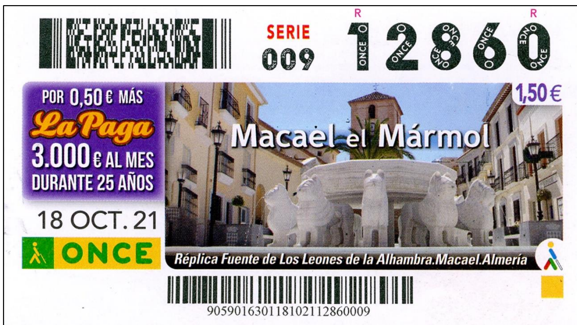
Figura 5. Fuente de Macael